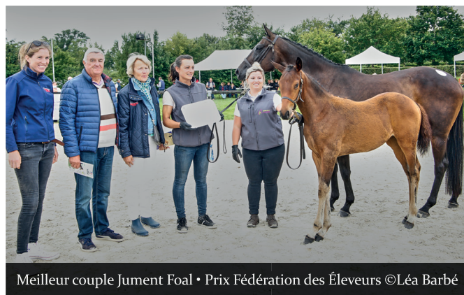
Meilleur couple Jument Foal • Prix Fédération des Éleveurs

Merci à l'ANCCO pour ce texte et les photos qui l'accompagnent.