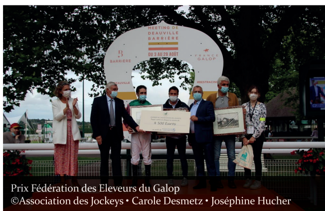
Prix Fédération des Eleveurs du Galop ©Association des Jockeys • Carole Desmetz • Joséphine Hucher