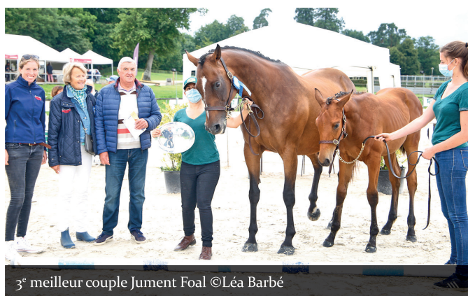
3 e meilleur couple Jument Foal