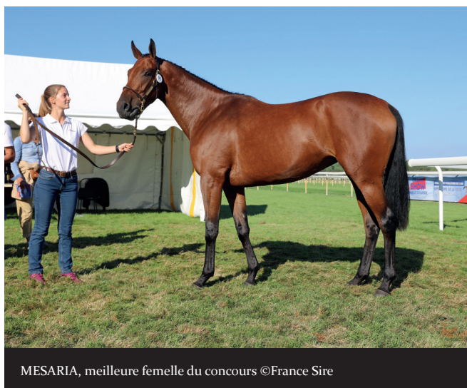
MESARIA, meilleure femelle du concours