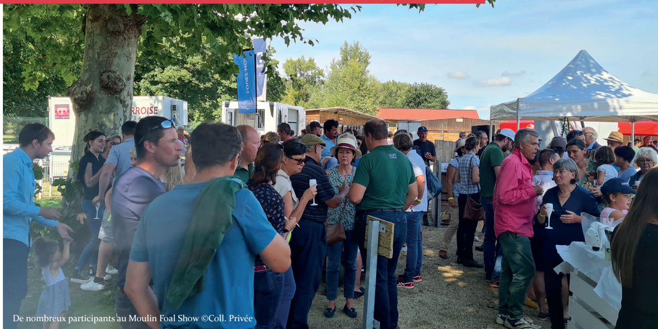
De nombreux participants au Moulin Foal Show