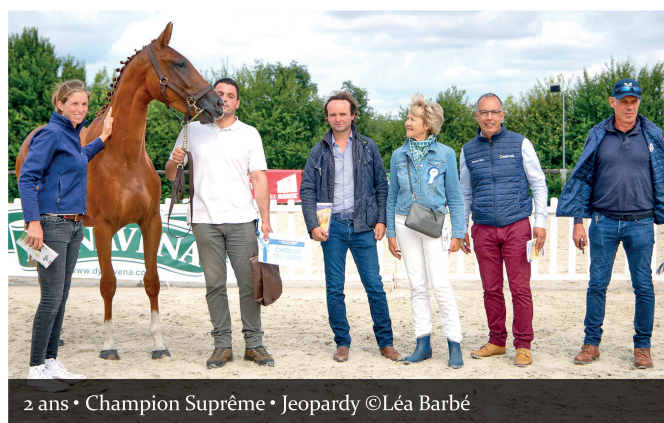
2 ans • Champion Suprême • Jeopardy