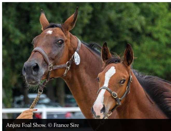
Anjou Foal Show.