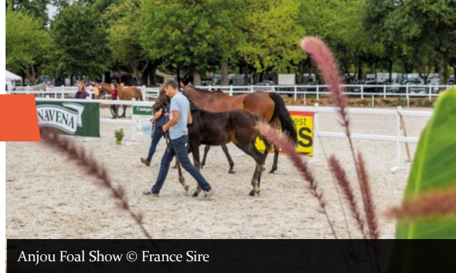
Anjou Foal Show

De nombreux éleveurs nous ont exprimé leur satisfaction, un nombre conséquent de transactions amiables ayant pu être réalisées, nous récompensant ainsi de nos efforts.