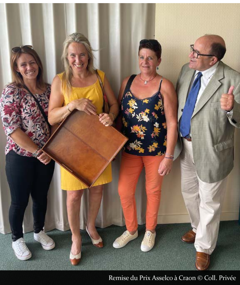
Remise du Prix Asselco à Craon