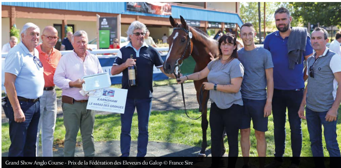
Grand Show Anglo Course - Prix de la Fédération des Éleveurs du Galop