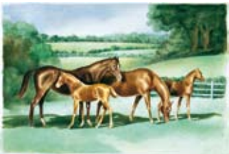
Syndicat des éleveurs