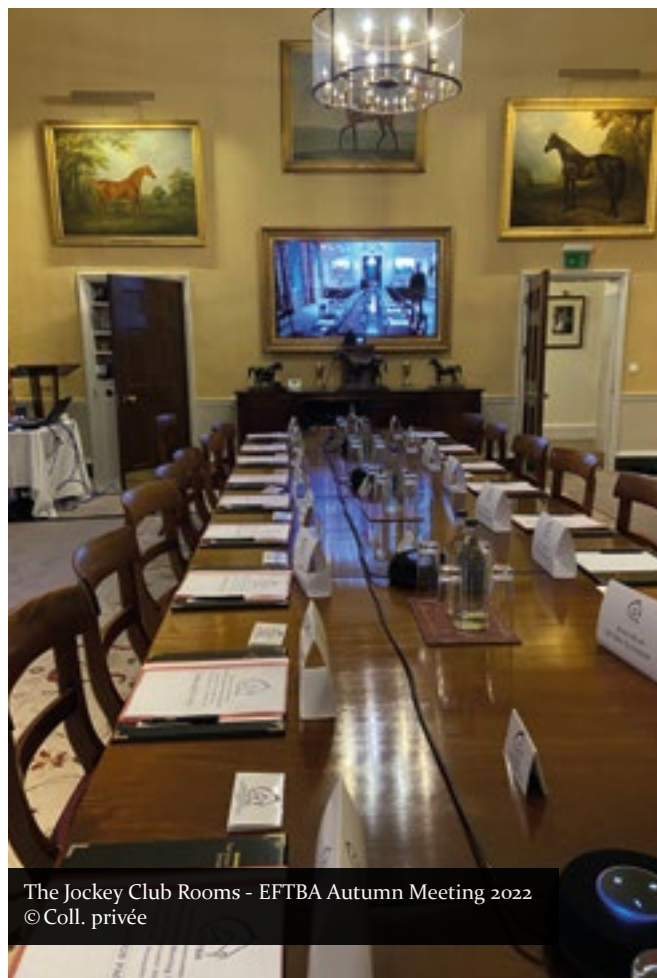
The Jockey Club Rooms - EFTBA Autumn Meeting 2022

Enfin, une discussion s'est engagée sur le nombre de courses black type dans les pays membres de l'EFTBA.