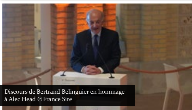
Discours de Bertrand Belinguier en hommage à Alec Head