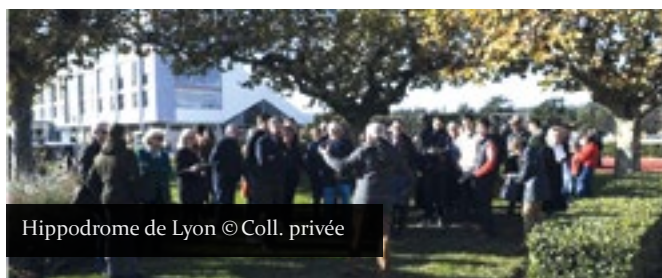
Hippodrome de Lyon

Le second s'est tenu sur l'hippodrome de Lyon-Parilly, le 20 novembre lors d'une journée courses 100 % obstacle et a réuni une centaine de participants dont la moitié de néophytes autour d'un cocktail déjeunatoire à partir de midi, permettant des moments d'échange privilégiés. Au cours de l'après-midi, une visite des écuries, l'accès au rond et aux ordres d'avant course ainsi que la rencontre avec des entraîneurs dont Mathieu Pitart ont été très appréciés. Ainsi, 3 couples venus des sports équestres ont montré un intérêt pour le propriétaire de chevaux de courses dont 2 sont d'ores et déjà prêts à s'associer sur une pouliche. La réussite de cet événement a reposé sur un partenariat efficace entre France Galop à travers la mobilisation de 2 personnes, l'hippodrome de Lyon-Parilly et son président Jean-Claude Ravier (Accueil, mise à disposition d'espaces privilégiés dont les salons de réception, accès au rond et aux